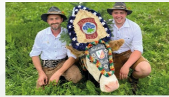
Larch Peter „Neubauhof“ von der Pfundsalm | Hochfügen im Zillertal